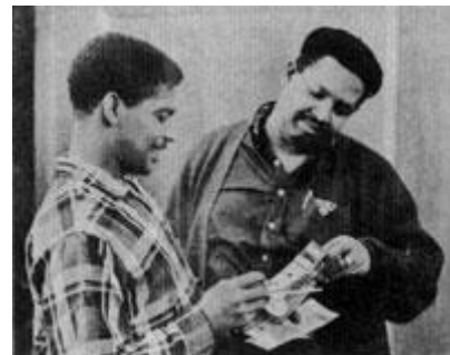
Wilkerson with producer "Cannonball"

ドン・ウィルカーソンは1932年ルイジアナに生まれ、高校の時にアルトサックスをはじめ、やがて長じて、Amos Milburnのバンドに参加、ホッジス系のアルトとして40